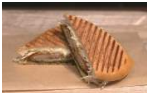
サメフライパニーニ 500円(税込)

VOL.8では「レストランテロス クエントス デル マール」の美味しいメニューをご紹介します